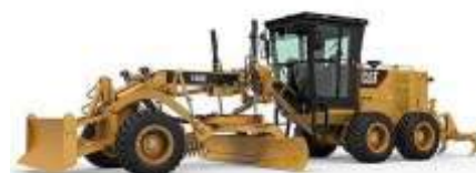
MOTONIVELADORA 140K, 120K