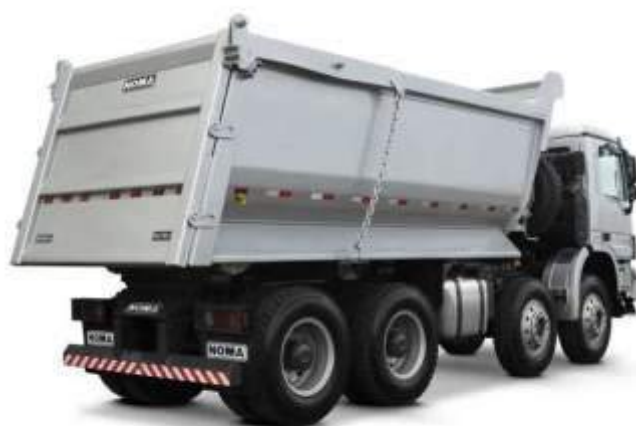
CAMINHÃO BASCULANTE BI-TRUCK 18 M3 TRAÇADO