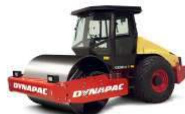
ROLO COMPACTADOR DYNAPAC CA250