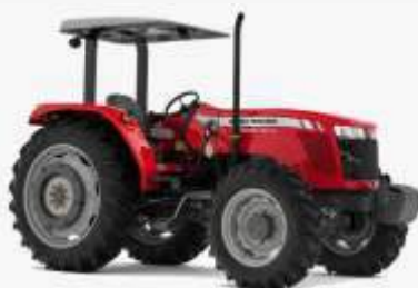
TRATOR AGRÍCOLA MASSEY FERGUSON 4200