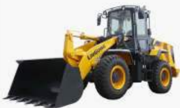
PÁ CARREGADEIRA LIUGONG 835