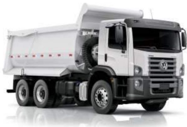
CAMINHÃO BASCULANTE TRAÇADO 15 M3