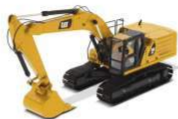
ESCAVADEIRAS HIDRÁULICA 336, 320